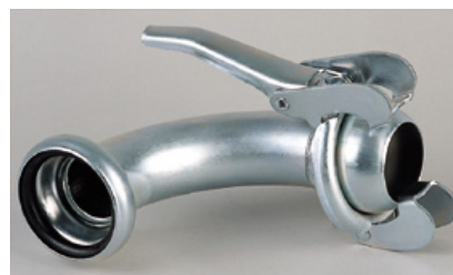
CURVA 90° CON TOMA BAUER HEMBRA MACHO