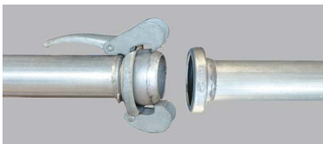
TUBO DE ALUMINIO O ACERO CON TOMAS BAUER