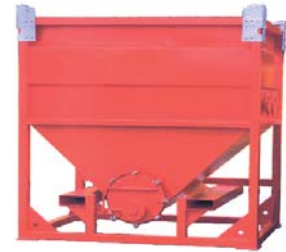
Depósito decantador de filtrado y recogida de sedimentos

aquellos lugares donde no hay toma eléctrica y se precisa de autonomía propia. En este rango de máquinas encontramos la serie Cd para gran cantidad de agua, la serie HL para una larga impulsión del agua, la serie insonorizada para espacios urbanos y los modelos con bombas sumergible hidráulicas accionadas por un grupo hidráulico autónomo. Con esta gama de equipos de bombeo TST lidera el mercado de las bombas de agua de alquiler.