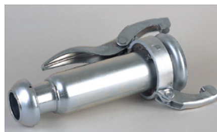
REDUCCIÓN CON TOMAS BAUER MACHO HEMBRA