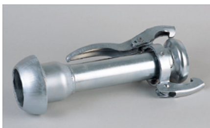
AMPLIACIÓN CON TOMAS BAUER HEMBRA MACHO