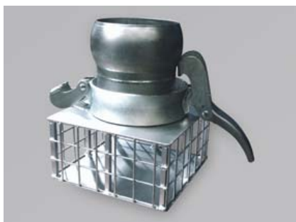
FILTRO COLADOR CON TOMA BAUER MACHO