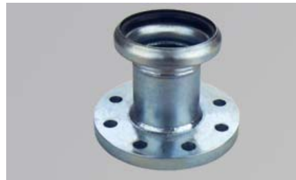
BRIDA CON TOMA BAUER HEMBRA